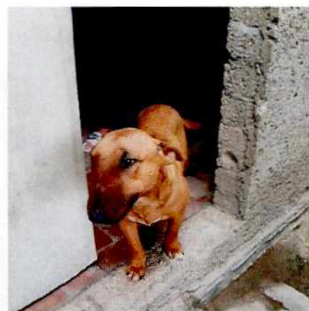
Fotografía 4-6. Ejemplares caninos del inmueble.

En virtud de lo antes expuesto, esta Entidad considera procedente emitir la presente resolución, de conformidad con el artículo 27 fracción VI de la Ley Orgánica de esta Procuraduría, por la improcedencia legal, toda vez que los ejemplares caninos evaluados en la segunda visita de reconocimiento de hechos contaban con bienestar animal.