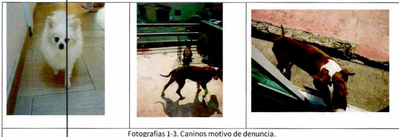
Fotografías 1-3. Caninos motivo de denuncia.

No. Folio: PAOT-05-300/200- 1 0 4 9 8 -2022