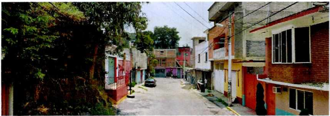
Imagen 1.- Muestra la consulta realizada en plataforma digital a fin de ubicar la calle de los hechos denunciados.

En este sentido, de las constancias que obran en el presente expediente, se desprende que personal de esta Subprocuraduría llevó a cabo una visita de reconocimiento de hechos, de acuerdo a lo establecido en el artículo 15 BIS 4 fracción IV de la Ley Orgánica de esta Entidad, diligencia durante la cual personal de esta entidad realizó un recorrido por la calle Ocote, en busca de la manzana 7, lote 14, sin embargo, dicho lugar no fue encontrado, asimismo, se realizó una consulta virtual en las páginas electrónicas de Google Maps, así como de la Secretaría de Desarrollo Urbano y Vivienda de la Ciudad de México, en las que no fue posible localizar el domicilio.