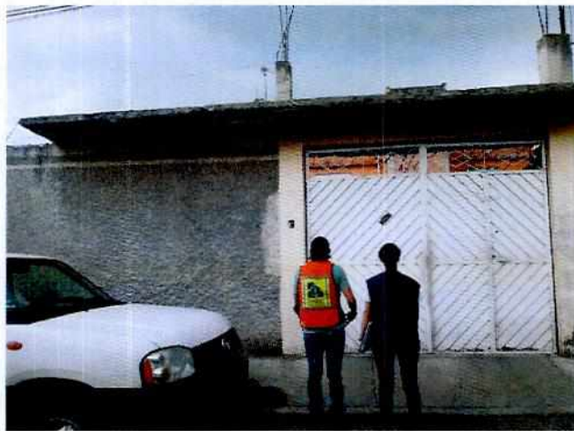
Fotografía 1. Lugar de los hechos denunciados.

En este sentido, de las constancias que obran en el presente expediente, se desprende que personal de esta Subprocuraduría llevó a cabo una visita de reconocimiento de hechos, de acuerdo a lo establecido en el artículo 15 BIS 4 fracción IV de la Ley Orgánica de esta Entidad, diligencias durante la cual no se permitió el acceso al inmueble.