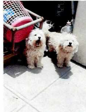
Fotografías 1 y 2. Ejemplares denunciados.

En seguimiento de lo anterior, personal de esta Subprocuraduría tuvo comunicación por vía telefónica con el propietario de los ejemplares, con la finalidad de dar seguimiento a la recomendación antes mencionada, constatando por medio de evidencia fotográfica enviada por aplicación de celular de mensajería instantánea, que la persona encargada del cuidado de los caninos, llevó a cabo los cambios en la alimentación del ejemplar "Patuleco", para el intento de aumento de peso, como lo recomendó personal de esta Entidad, teniendo en cuenta de que se trata de un ejemplar geriátrico.