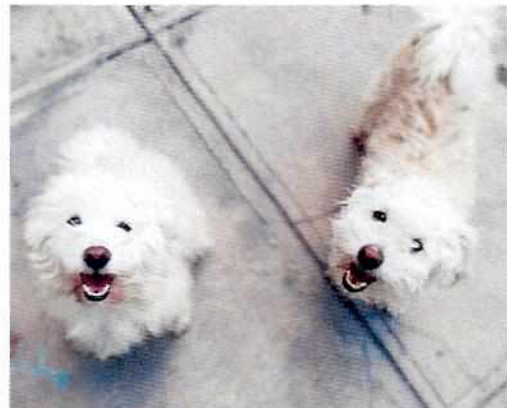
Fotografías 3 y 4. Evidencia de la recomendación y de los ejemplares caninos que se encontraban bien.

En virtud de lo antes expuesto, esta Entidad considera procedente emitir la presente resolución, de conformidad con el artículo 27 fracción VII de la Ley Orgánica de esta Procuraduría, por el cumplimiento voluntario de las disposiciones jurídicas en materia de bienestar animal.