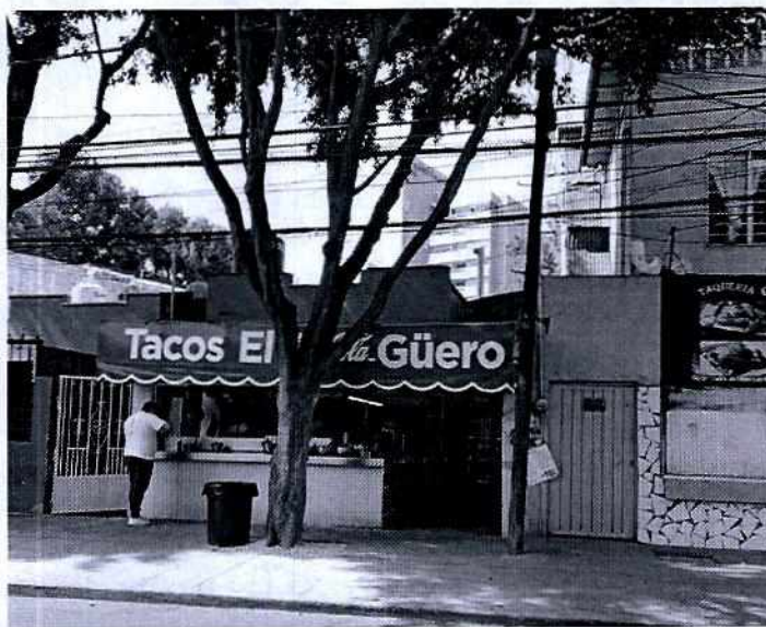
Soporte fotográfico de la fachada del establecimiento denunciado

Al respecto, el 18 de julio de 2019 personal adscrito a esta Subprocuraduría realizó un reconocimiento de hechos al domicilio ubicado en calle José Morán, número 22, Colonia San Miguel Chapultepec Sección I, Alcaldía Miguel Hidalgo, durante el cual constató el funcionamiento del establecimiento mercantil denominado "Taquería El Güero", en dicho acto notifico el oficio citatorio PAOT-05-300/200-6248-2019.