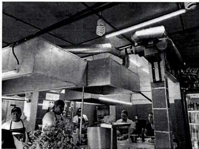
Instalación de campana y equipos extractores.

Por lo anterior, el 3 de septiembre de 2019 el personal adscrito a esta Subprocuraduría realizó un reconocimiento de hechos al establecimiento mercantil denunciado, durante el cual constató la colocación de una campana y equipos de extractores.