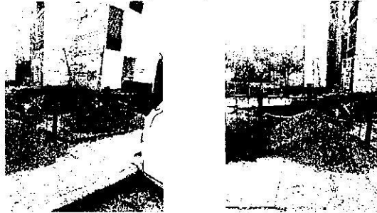
Imágenes presentadas por la persona denunciante

Lo anterior se robustece con lo presentado por la persona denunciante en fecha 24 de marzo de 2023, en la cual se identificaron fotografías relacionadas con los trabajos de obra ejecutados en el predio de mérito, consistentes la colocación de una plancha de concreto, la preparación de castillos para la posterior instalación de techumbre, así como personal y material de construcción, mismas que se presentan a continuación:-----