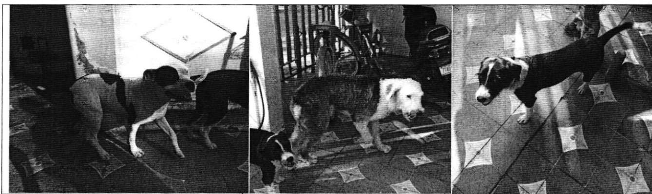
Ejemplares caninos objeto de denuncia.

Finalmente, mediante oficio se hizo del conocimiento de la persona responsable de los ejemplares caninos en comento, la legislación en materia de bienestar animal conminándola a su debido cumplimiento.