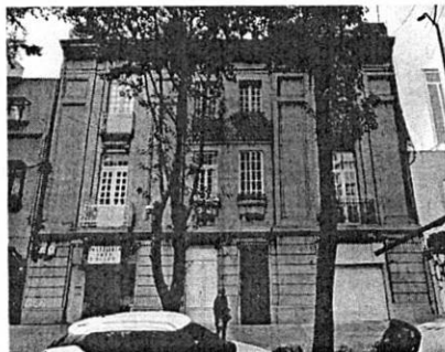
Septiembre, 2019

Ahora bien, con la finalidad de allegarse de mayores elementos, personal adscrito a esta Subprocuraduría realizó un análisis multitemporal con las imágenes de Google Maps, en las que se observa que hasta septiembre de 2019 el local comercial ubicado en el lado oeste de la planta baja del inmueble investigado, no contaba con anuncios ni letreros; sin embargo, en la evidencia fotográfica obtenida durante los reconocimientos de hechos realizados por personal adscrito a esta unidad administrativa en 2021 , se advierte que en el local comercial se colocaron tres letreros sobre el dintel, tal y como se observa en las siguientes imágenes: -----