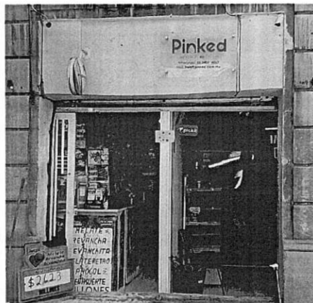
Foto aportada por el propietario del local comercial.

Derivado del análisis anterior, es importante mencionar que la persona que se ostentó como propietario del local comercial investigado, manifestó en el escrito previamente referido, que había retirado los letreros colocados en el local, y anexó como medio de prueba una imagen fotográfica; sin embargo, se observa que únicamente se retiró el anuncio de "Coca-Cola" , conservando los letreros de "Pronóstico/Melate" y de "Pinked", tal y como se advierte en la siguiente imagen: -----