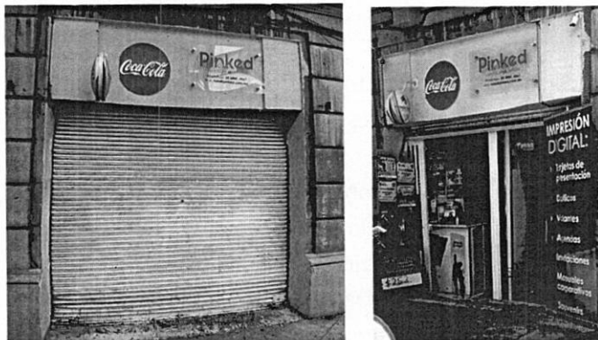
Fotos: Reconocimientos de hechos realizado por PAOT, en los meses de abril y noviembre de 2021.

Derivado del análisis anterior, es importante mencionar que la persona que se ostentó como propietario del local comercial investigado, manifestó en el escrito previamente referido, que había retirado los letreros colocados en el local, y anexó como medio de prueba una imagen fotográfica; sin embargo, se observa que únicamente se retiró el anuncio de "Coca-Cola" , conservando los letreros de "Pronóstico/Melate" y de "Pinked", tal y como se advierte en la siguiente imagen: -----