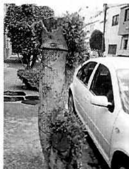
Figuras 1-5. Se observan el individuo arbóreo motivo de denuncia, el cual fue desmochado y tiene cemento en su cajete.

Por lo anterior, se citó a comparecer a la persona habitante del inmueble en mención, por lo que durante comparecencia manifestó que el individuo arbóreo anteriormente fue afectado al ser golpeado por un vehículo, lo que ocasionó la fractura de sus ramas y la inclinación de su tronco; razón por la que se solicitó a la Alcaldía llevar a cabo las acciones necesarias para eliminar el riesgo que significaba, sin embargo al no haber obtenido respuesta, llevó a cabo el corte de la rama fracturada.