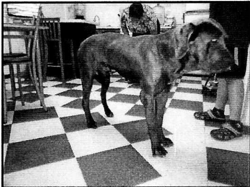
Imagen. Ejemplar canino de nombre "Omega".