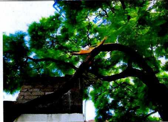
Fotografías 1 y 2. Aportadas por la persona señalada como presunta responsable de realizar los hechos denunciados, es posible observar el desprendimiento de la rama.