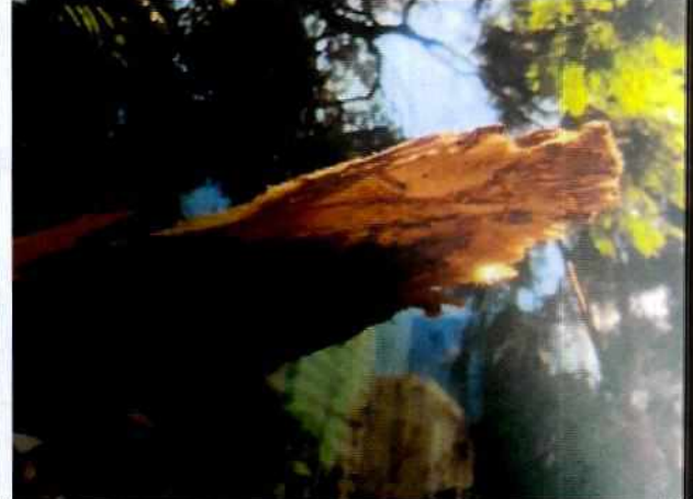
Fotografías 3 y 4. Detalles del desgaje o desprendimiento de la corteza, la cual presenta síntomas de insectos xilófagos o barrenadores, así como el desprendimiento de la corteza.

En este sentido, al no encontrar contravención alguna a la Ley Ambiental de Protección a la Tierra en el Distrito Federal, ya que como quedó señalado en la Opinión Técnica con número de folio PAOT-2019-881-DEDPPA-339, emitida por personal adscrito a esta Subprocuraduría, el árbol de mérito no fue objeto de poda alguna, ya que únicamente se le desprendió de manera natural una rama secundaria; esta Subprocuraduría Ambiental, de Protección y Bienestar a los Animales puede dar por concluida la presente investigación en apego al artículo 27 fracción III de la Ley Orgánica de la Procuraduría Ambiental y del Ordenamiento Territorial de la Ciudad de México, el cual señala: (...) III. Cuando se han realizado las actuaciones previstas por esta ley y su Reglamento, para la atención de la denuncia (...).