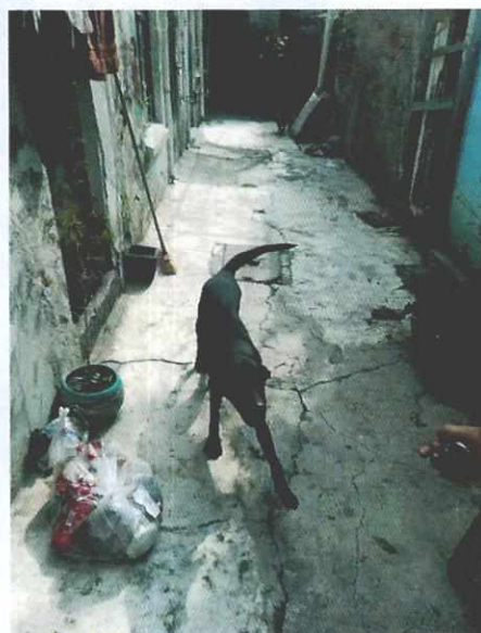
Imagen 2. Ejemplar canino de nombre "Hilga".