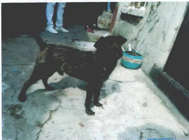
Imagen 1. Ejemplar canino de nombre "Egris".

Por lo anterior y considerando que no se detectaron signos de maltrato animal, y no quedando actuaciones pendientes por parte de esta Subprocuraduría para el caso que nos ocupa, se procede a dar por concluida la investigación de la denuncia ciudadana bajo el número de expediente al rubro, con fundamento en el artículo 27 fracción III de la Ley Orgánica de la Procuraduría Ambiental y del Ordenamiento Territorial de la Ciudad de México.