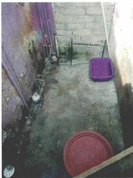
Imagen 3. Recipiente de agua limpia.

Expediente: PAOT-2019-2472-SPA-1439 No. de Folio: PAOT-05-300/200-13026-2019