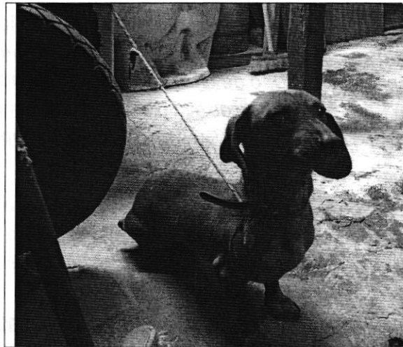
Ejemplar canino observado.

Finalmente, mediante oficio se hizo del conocimiento de la persona responsable del ejemplar canino en comento, la legislación en materia de bienestar animal conminándola a su debido cumplimiento.