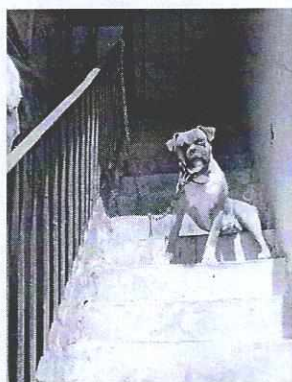
Fotografía 1. Ejemplar canino motivo de denuncia.