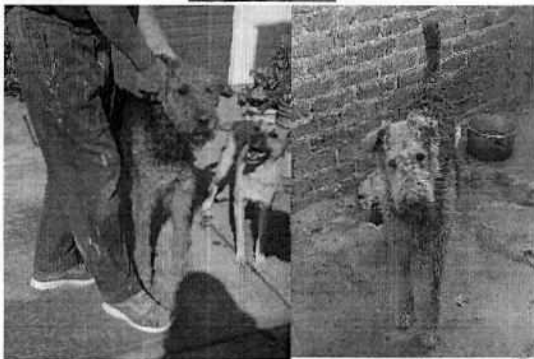
Ejemplar motivo de denuncia "Rafiki"

Medellín 205, piso 4, colonia Roma Sur Avenida Camilitano, C.P. 06680, Ciudad de México Tel. 5205-0780 ext 12011 Y 12400