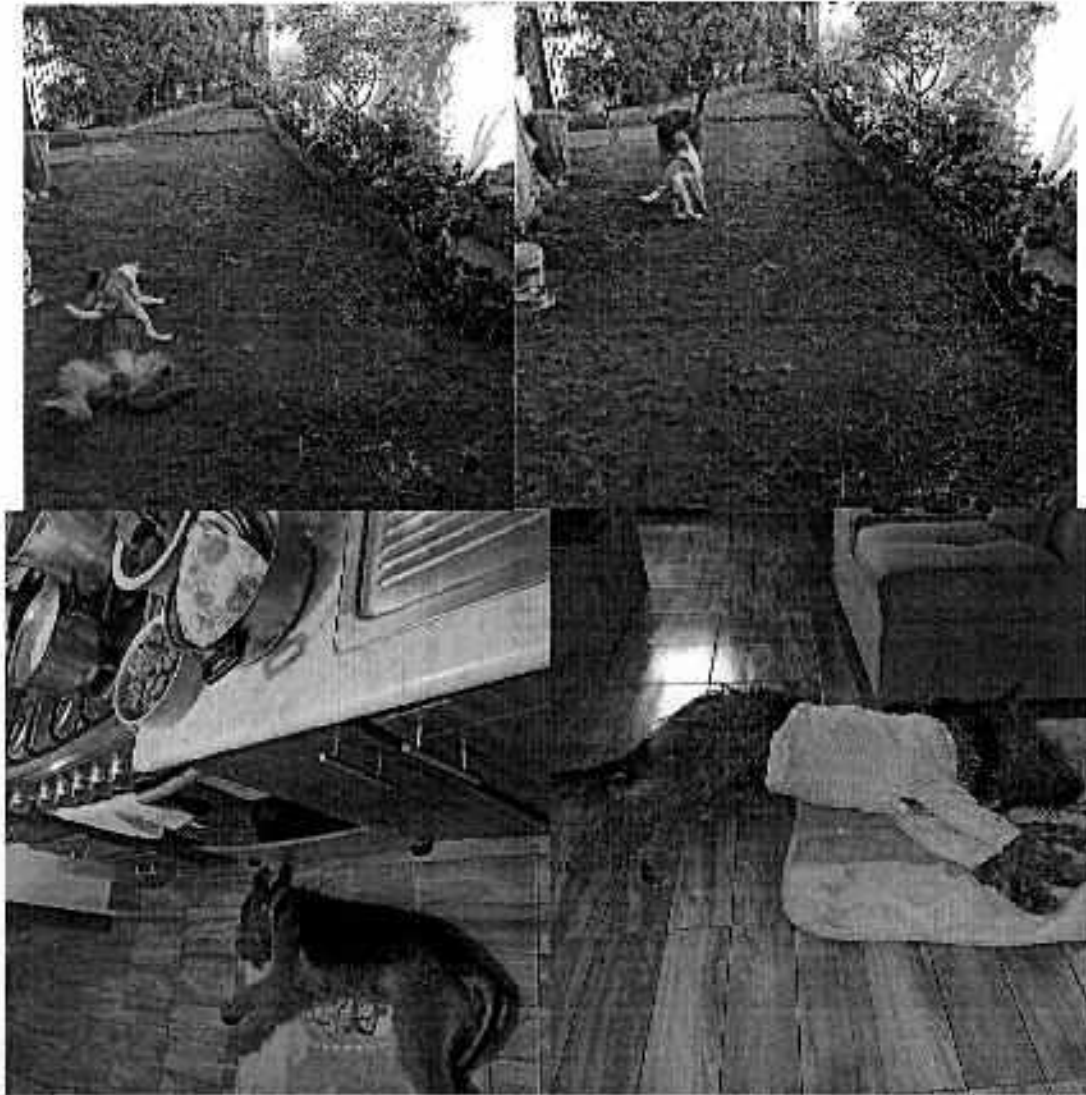
Ejemplar motivo de denuncia "Rafiki"

Es de resaltar que, en el Acuerdo de Admisión, que fue enviado por correo electrónico a la persona denunciante, se le hizo de conocimiento que contaba con un término de seis días hábiles para aportar las pruebas que estimara pertinentes en la investigación de los hechos, lo anterior conforme al artículo 90 del Reglamento de la Ley Orgánica de la Procuraduría Ambiental y del Ordenamiento Territorial de la Ciudad de México; sin embargo durante el procedimiento de Investigación, no fueron proporcionados elementos de prueba que pudieran determinar incumplimiento a la normatividad en materia de bienestar animal.