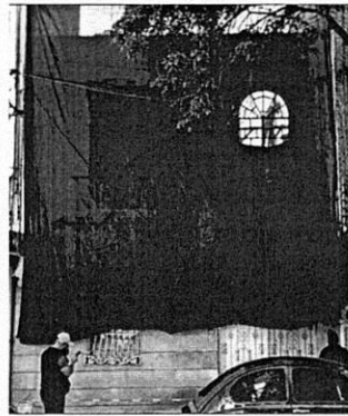
Imagen 2: PAOT Reconocimiento de hechos de fecha 27 de octubre 2021. Se constataron trabajos de demolición al interior del inmueble y en fachada.