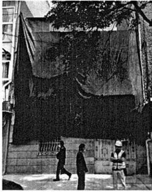
Imagen 1: PAOT Reconocimiento de hechos de fecha 22 de octubre 2021. Inmueble de 2 niveles de altura cubierto con malla sombra.

construcción de un balcón en una de las ventanas del segundo nivel y la demolición del pretil en azotea que era continuo a la fachada, en su lugar se colocó una dala de cerramiento; no cuenta con letreo con información alguna de la obra. -----