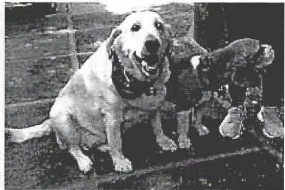
Fotografías 3, 4 y 5. “Scooby”, “Max”, “Maya” y “Domingo” respectivamente.

Respecto al espacio que ocupan los animales, se observa que deambulan libremente por el patio principal del inmueble, además de que cuentan con un cuarto techado de aproximadamente 8 m 2 en donde cuentan con tarimas sobre las cuales descansan; en el sitio se constató la presencia de tres recipientes de 20 litros cada uno, con agua limpia a su libre disposición, así como un plato con croquetas.