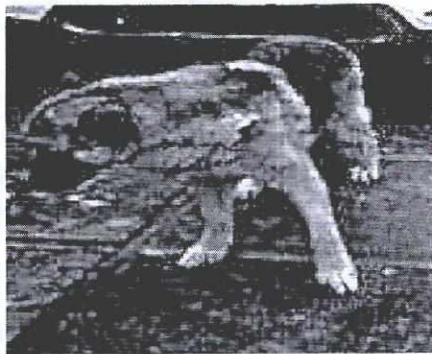
Fotografías 1 y 2. "Mu" y "Romel".