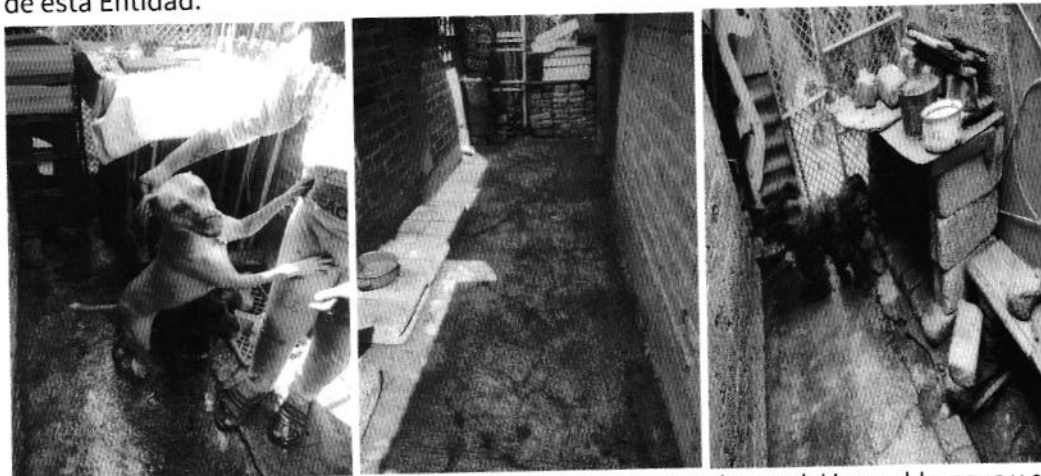
Fotografías 4, 5 y 6.- Ejemplares motivo de denuncia de manera libre dentro del inmueble, agua y comida.

En seguimiento de lo anterior, personal de esta Subprocuraduría llevó a cabo una nueva visita de reconocimiento de hechos con la finalidad de dar seguimiento a las recomendaciones antes mencionadas, constatando que la persona encargada del cuidado de los caninos llevó a cabo las recomendaciones realizadas por personal de esta Entidad.