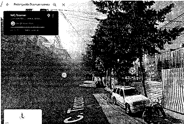
Google Maps: junio de 2022