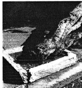
Calle Julieta número 35, Colonia Guadalupe Tepeyac, Alcaldía Cuauhtémoc

En razón de lo anterior, se concluye que por las características del individuo arbóreo señalado con anterioridad, se desplomó debido a causas ajenas a lo denunciado. Así mismo, no se constató la emisión de ruido en el predio motivo de investigación, toda vez que no se constató la operación del establecimiento con giro de salón de fiestas en el predio de mérito, por lo que se actualiza una imposibilidad material prevista en el artículo 27 fracción VI de la Ley Orgánica de la Procuraduría Ambiental y del Ordenamiento Territorial de la Ciudad de México.-----