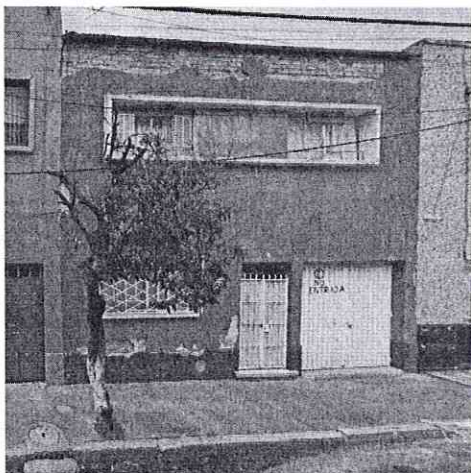
Noviembre 2008 – Mayo 2019