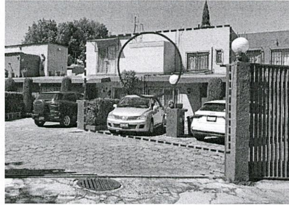
Reconocimiento de hechos de fecha 10 de marzo de 2022.

Al respecto, el artículo 28 del Reglamento de Construcciones para la Ciudad de México, establece que no podrán ejecutarse nuevas construcciones, obras o instalaciones de cualquier naturaleza, en Área de Conservación Patrimonial sin recabar previamente la autorización de la Secretaría de Desarrollo Urbano y Vivienda de la Ciudad de México. -----