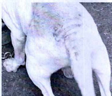
FOTOGRAFÍA.- Vista de la zona que presentaba alopecia.