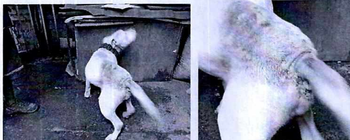
FOTOGRAFÍAS.- Vistas del ejemplar canino con acercamiento a la zona de alopecia.

En virtud de lo antes expuesto, es de señalar que derivado de la intervención de esta Procuraduría: