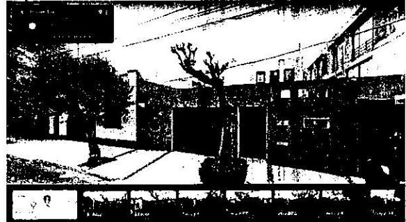
Fuente: captura de Street View de julio de 2022.

A efecto de mejor proveer y en respuesta a la solicitud realizada por esta Subprocuraduría, la Dirección General de Desarrollo Urbano y Servicios Urbanos de la Alcaldía Azcapotzalco, informó que para el predio de mérito no se localizó documentación que ampare trabajos constructivos, asimismo señalo que de una