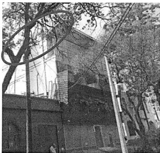
GOOGLE MAPS JULIO 2019

En este sentido, personal adscrito a esta Subprocuraduría, de conformidad con los artículos 21 y 25 fracción VIII de la Ley Orgánica de esta Entidad, y 56 antepenúltimo párrafo de la Ley de Procedimiento Administrativo de la Ciudad de México, de aplicación supletoria, a efecto de allegarse y desahogar todo tipo de elementos probatorios para el mejor conocimiento de los hechos sin más limitantes que las señaladas en la Ley de Procedimiento Administrativo del Distrito Federal, siendo que en los procedimientos administrativos se admitirán toda clase de pruebas, excepto la confesional a cargo de la autoridad y las que sean contrarias a la moral, al derecho o las buenas costumbres ; en fecha 12 de mayo de 2022, realizó la consulta al Sistema de Información Geográfica Google Maps, vía Internet ( http://www.google.com/earth/ ), y con ayuda de la herramienta Street View, en la cual se localizaron imágenes aéreas y a pie de calle, con antigüedad de dos años del predio denunciado, se constató que en el año 2021 en la azotea del inmueble se instaló una estructura a base de tubería metálica cuadrada, la cual no se encontraba en el año 2019. Acta circunstanciada que tiene el carácter de documental pública y que se valora en términos de los artículos 327 fracción II y 402 del Código de Procedimientos Civiles para la Ciudad de México y 30 BIS de la Ley Orgánica de la Procuraduría Ambiental y del Ordenamiento Territorial de la Ciudad de México. -----