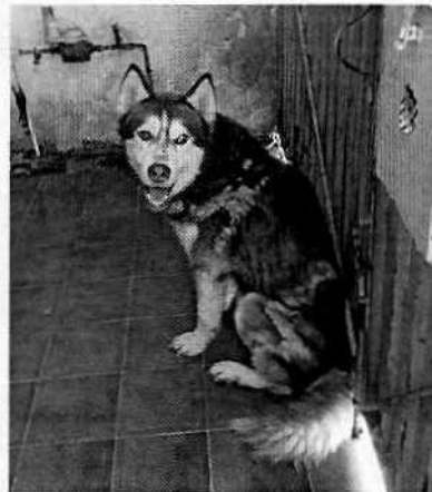
Se muestra al ejemplar canino.

No obstante lo anterior, mediante oficio se hizo del conocimiento de la persona responsable del ejemplar canino objeto de investigación, las responsabilidades que se tienen que cumplir al tener animales de compañía, conminándolo a su debido cumplimiento.