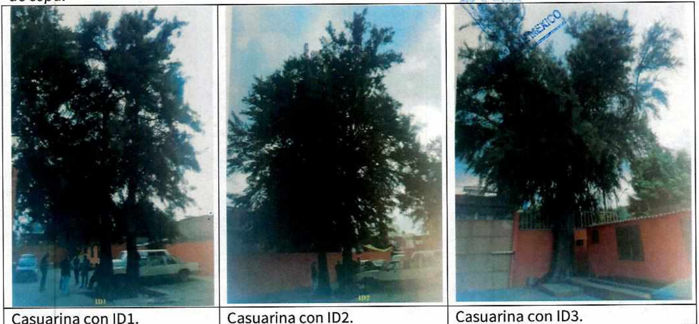
Casuarina con ID1.

Tercera. La permanencia del árbol con ID1 en su sitio es factible siempre y cuando se realice una poda de aclareo de copa. Por otra parte, es recomendable que se contenga el avance de la pudrición fúngica en el tronco, con un tratamiento de endoterapia vegetal a base de inyección directa en el sistema vascular de un producto prescrito y aplicado por un profesional especializado. El árbol con ID2 no requiere ninguna acción de manejo y el árbol con ID3 solamente requiere una poda de aclareo de copa.