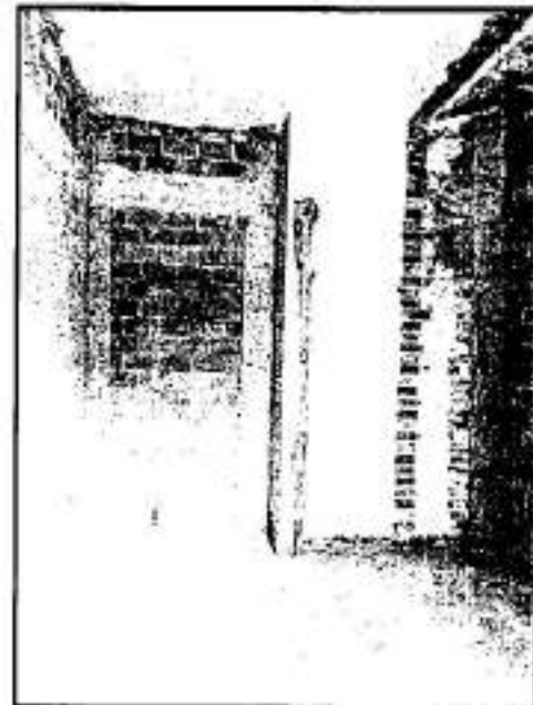
Imagen: Implementación de muros divisorios, refuerzos estructurales con base en muros de concreto, del como tratado de instalaciones; tomada durante el reconocimiento de hechos de fecha 24 de junio de 2021.