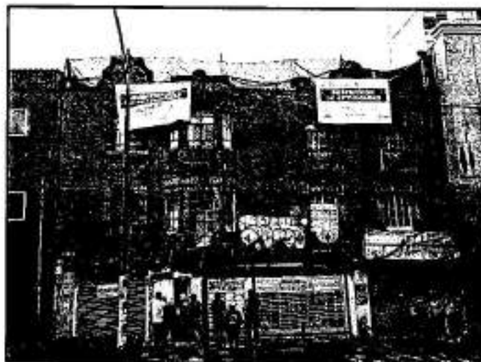
Imagen: Imposición de medida precautoria en el inmueble investigado por parte de PAOT/CDMX; tomada en fecha 24 de junio de 2021.