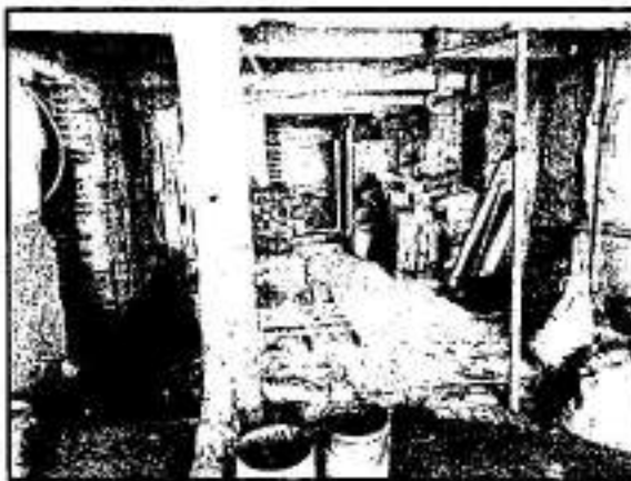
Imagen: Retirados de aplastados y vestigios de demolición de elementos estructurales; tomada durante el reconocimiento de hechos de fecha 24 de junio de 2021