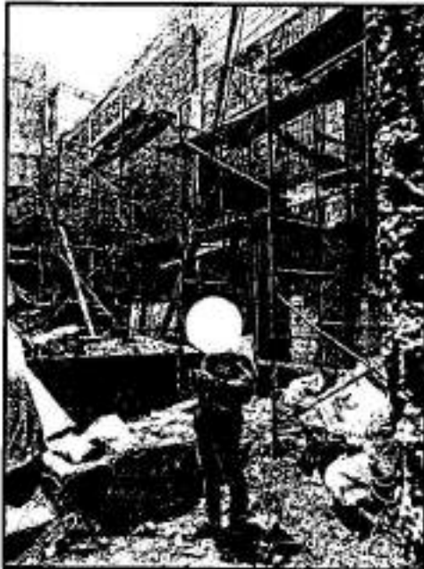
Imagen: Bodega localizada en la colindancia sur, entre los cuerpos constructivos, con trabajos de ampliación e través de muros de concreto, muros de tabique, tomada durante el reconocimiento de hechos de fecha 24 de junio de 2021.