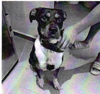
Fotografía 1. Vista del ejemplar canino que responde al nombre de "Laska".