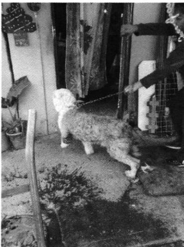
Fotografía 4. Retiro del ejemplar de la vía pública.

En seguimiento de lo anterior, personal de esta Subprocuraduría constató que el ejemplar canino fue retirado de la vía pública y posteriormente se mantuvo comunicación con la persona a cargo del ejemplar canino, la cual refirió que después de la visita de reconocimiento de hechos, mantiene al ejemplar canino en su negocio en un horario de 09:00 horas a 15:00 horas y posteriormente lo ingresa a su inmueble.