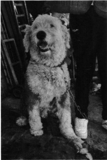
Fotografía 1. Ejemplar denunciado.