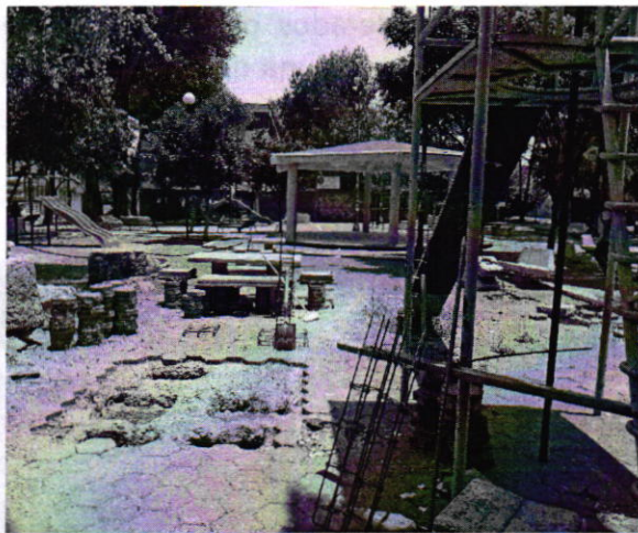
Fotografía 1. Vista del sitio referido en el escrito de denuncia.

En este sentido, personal de esta Subprocuraduría realizó visita de reconocimiento de hechos en el lugar de la denuncia, de acuerdo a lo establecido en el artículo 15 BIS 4 fracción IV de la Ley Orgánica de esta Entidad, durante la cual observó que éste corresponde a un espacio público (parque), en el que se encontraban realizando actividades de construcción del Proyecto de Mejoramiento Barrial 2018 denominado “Mejorando mi Parque”, en un área cubierta por adoquín. Aunado a lo anterior, se constató la existencia de cinco individuos arbóreos de las especies Cupressus lindleyi (1), Erythrina sp. (1) y Populus alba (3), los cuales presentaban indicios de afectación por la presencia de muérdago.