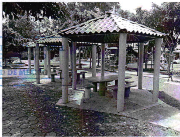
Fotografías 2 y 3. Vista del sitio referido en el escrito de denuncia.