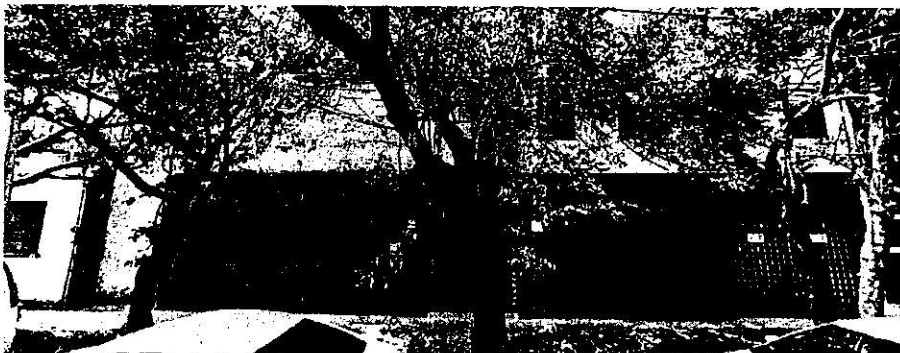
Vista a pie de Calle del Inmueble Preexistente (Fuente: Google Street View 2019).

Lo anterior, en contraste con lo constatado en los reconocimientos de hechos, así como de las constancias que obran en el expediente, no se advierten modificaciones en el inmueble preexistente, tal y como se muestra en las siguientes imágenes: -----