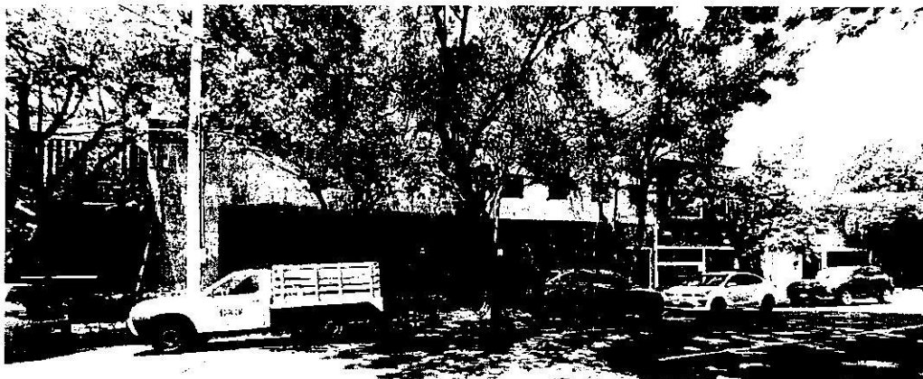
Vista del inmueble objeto de investigación (Fuente: Reconocimiento de Hechos 12-06-2023).

Sin embargo, esta Subprocuraduría emitió oficio dirigido al propietario, poseedor y/o director responsable de obra del inmueble objeto de investigación; a efecto de que realizara las manifestaciones que conforme a derecho corresponden y presentara las documentales que acreditaran la legalidad de los trabajos de construcción. Al respecto, quien se ostentó como Representante Legal de la persona moral propietaria del predio mediante escrito de fecha 29 de noviembre de 2022, manifestó lo siguiente: -----