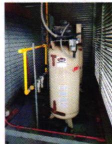
Figuras 1 y 2. Vista del establecimiento mercantil motivo de denuncia y equipo generador de ruido.

Al respecto, durante acto de comparecencia celebrada en las oficinas de esta Entidad, una persona que se ostentó como apoderado legal del establecimiento mercantil motivo de investigación, manifestó lo siguiente: