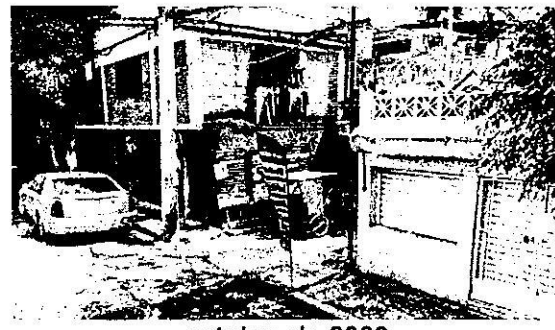
octubre de 2022