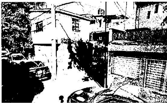
enero de 2019