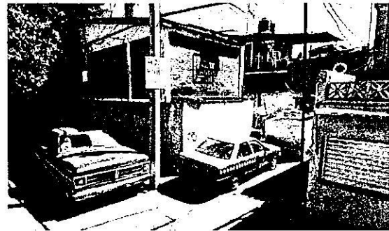
febrero de 2015