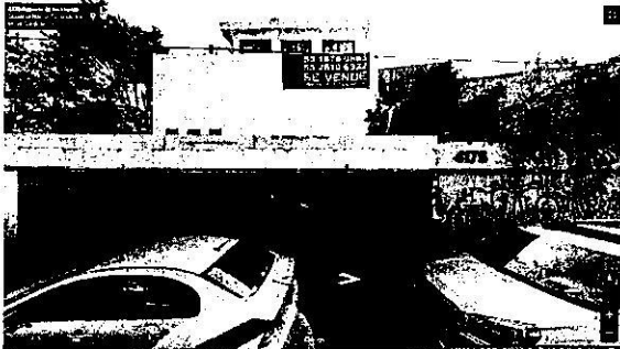
Google Maps-Street View: enero de 2019.

preexistente de 3 niveles de altura con terraza, delimitado por un muro perimetral, cuyo costado oeste se encontraba dañado en el año 2019 y completamente restaurado para el año 2022. Así mismo se constató que para noviembre de 2022 se amplió el muro perimetral solo en su costado poniente y desde agosto de 2019 ya no se observó el individuo arbóreo que se encontraba al interior del predio de mérito, tal como se muestra en las siguientes imágenes.-