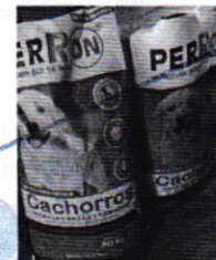
Figuras 1-6. Ejemplares caninos motivo de denuncia.