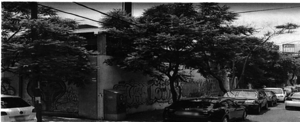
Julio de 2017

Por lo anterior, del reconocimiento de hechos realizados por personal adscrito a esta Entidad y de la consulta al programa Google Earth utilizando la herramienta Street View se desprende la poda de 4 individuos arbóreos de más del 80 % de su copa, (sobre la calle Miguel de Mendoza) y el derribo de 2 individuos arbóreos (1 sobre calle Miguel de Mendoza y el otro sobre calle Merced Gómez); cabe señalar que en los cajetes correspondientes a los árboles derribados se plantaron 2 individuos arbóreos (de aproximadamente 1.30 m de alto), tal y como se muestra en las siguientes imágenes.-----