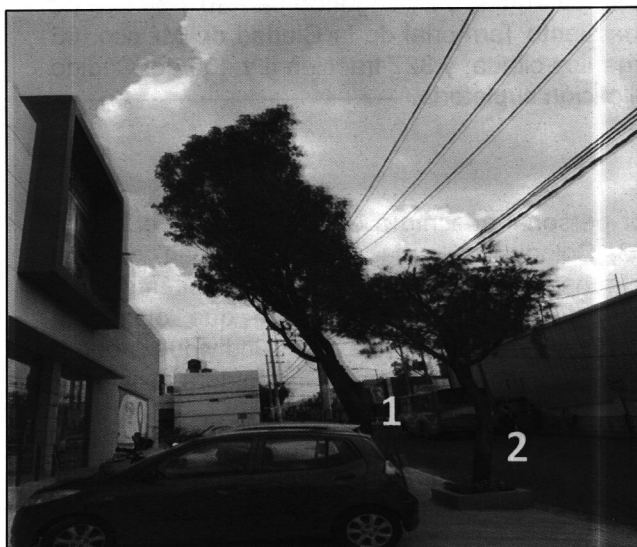
Reconocimiento de hechos 15 de Julio de 2019 en Avenida Corregidora

Por otro lado, personal adscrito a esta Subprocuraduría, de conformidad con los artículos 21 y 25 fracción VIII de la Ley Orgánica de esta Entidad, y 56 antepenúltimo párrafo de la Ley de Procedimiento Administrativo de la Ciudad de México, de aplicación supletoria, a efecto de allegarse y desahogar todo tipo de elementos probatorios para el mejor conocimiento de los hechos sin más limitantes que las señaladas en la Ley de Procedimiento Administrativo del Distrito Federal, siendo que en los procedimientos administrativos se admitirán toda clase de pruebas, excepto la confesional a cargo de la autoridad y las que sean contrarias a la moral, al derecho o las buenas costumbres; realizó un multitemporal de imágenes Street View de fecha 2018 del programa de acceso libre Google Maps del predio objeto de denuncia en la que se identificó la existencia de tres individuos arbóreos en vía pública, ubicados en Avenida Corregidora, Colonia La Lonja, Alcaldía Tlalpan, lo cual se muestra a continuación para mayor referencia. -----