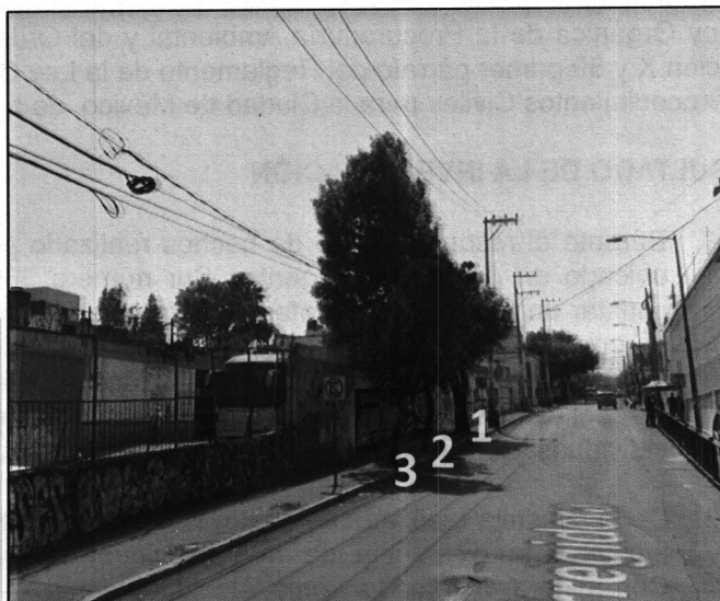
en Avenida Corregidora

En esas consideraciones, se tuvo que frente al predio de interés preexistían 3 individuos arbóreos y derivado de la construcción y habilitación de establecimientos mercantiles se llevó a cabo el derribo de arbolado. -----