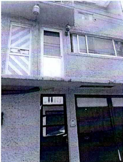
Fotografía 1. Inmueble motivo de denuncia.