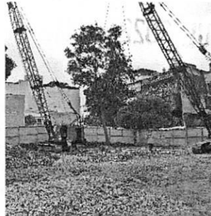
Imagen de individuo arbóreo ubicado en medio del predio.

En este sentido, personal adscrito a esta Subprocuraduría, realizó un análisis multitemporal del predio objeto de la presente denuncia, con imágenes obtenidas por medio de la página electrónica Google Earth, en las cuales se observó que, desde diciembre de 2009 hasta abril de 2020, se encontraban en pie dos individuos arbóreos al interior del predio. -----