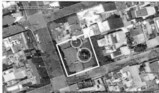
Imagen satelital de abril de 2020

No obstante lo anterior, durante una subsiguiente visita de reconocimiento de hechos al predio en comento, se constataron actividades de construcción al interior del predio en mención, observando que al interior existe solo un individuo arbóreo en pie, ubicado en la colindancia norte del mismo, sin observarse, tocones, esquilmos ni actividades de poda dentro del predio. Asimismo, sobre calle Oklahoma se constataron dos individuos arbóreos del tipo trueno, uno de los cuales se ubicada al límite de la colindancia lateral, y sobre calle Pensilvania, 5 individuos arbóreos, 4 fresnos y un trueno, uno los cuales ubicado entre los límites de la colindancia lateral. --