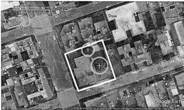
Imagen satelital de diciembre de 2009

En este sentido, personal adscrito a esta Subprocuraduría, realizó un análisis multitemporal del predio objeto de la presente denuncia, con imágenes obtenidas por medio de la página electrónica Google Earth, en las cuales se observó que, desde diciembre de 2009 hasta abril de 2020, se encontraban en pie dos individuos arbóreos al interior del predio. -----