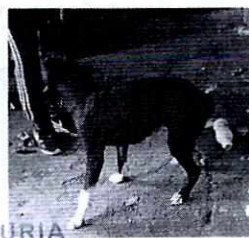
FOTOGRAFÍAS.- Vistas de los ejemplares caninos.