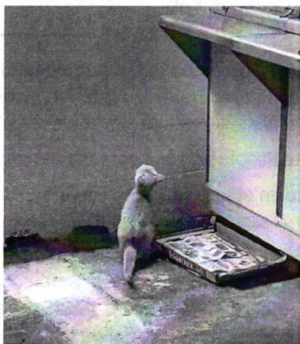
Fotografía 2. Vista del ejemplar felino que responde al nombre de "Sisi"

En virtud de lo anterior, se concluye que con las acciones realizadas por la persona responsable del ejemplar felino, se cumple con las condiciones adecuadas de bienestar respecto al alimento, agua, higiene, movilidad, alojamiento y comportamiento. Por lo anterior se da por concluida la investigación de conformidad con el artículo 27 fracción VII de la Ley Orgánica de la Procuraduría Ambiental y del Ordenamiento Territorial de la Ciudad de México.