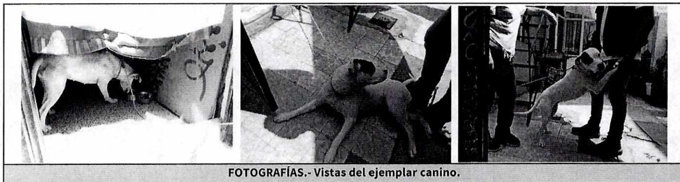
FOTOGRAFÍAS.- Vistas del ejemplar canino.

No obstante lo anterior, mediante el oficio correspondiente, se informó al responsable del ejemplar canino objeto de investigación, las obligaciones que prevé la Ley de Protección a los Animales de la Ciudad de México al contar con animales de compañía, conminándolo a su debido cumplimiento.