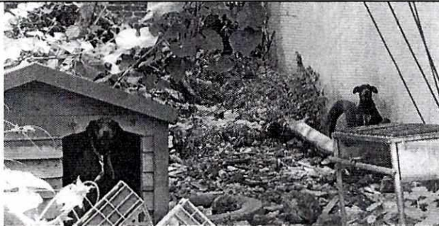
FOTOGRAFÍAS.- Vistas de los ejemplares caninos

Expediente: PAOT-2019-2987-SPA-1806 y acumulado PAOT-2019-3042-SPA-1848 No. Folio: PAOT-05-300/200-19409-2019