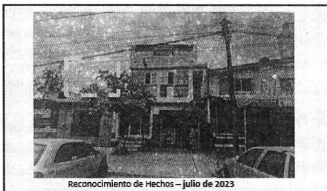
Reconocimiento de Hechos – julio de 2023

De lo anterior se desprende que entre los años 2019 y 2022 al interior del predio se realizó el derribo de tres árboles. -----