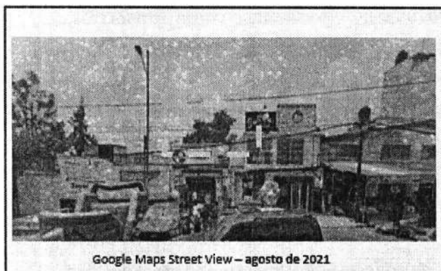
Google Maps Street View – agosto de 2021

de la Ley Orgánica de la Procuraduría Ambiental y del Ordenamiento Territorial de la Ciudad de México. Tal y como se observa en las siguientes imágenes: -----