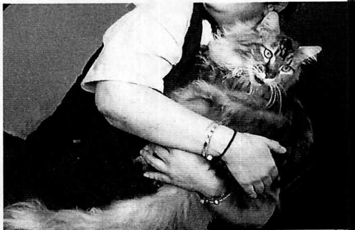
Fotografías 1 y 2. Vista de dos de los ejemplares felinos valorados por personal de esta Entidad.