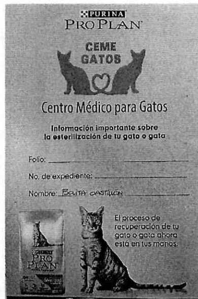
Fotografía 3. Ejemplo de una de las cartillas de atención médico-veterinaria.

No. de Folio: PAOT-05-300/200-13036-2019