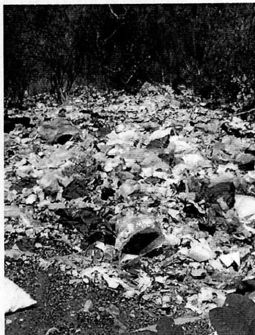
Fotografías 1 y 2. Residuos observados el personal de esta Entidad.

Al respecto, la Ley de Residuos Sólidos de aplicación para la Ciudad de México dispone en su artículo 33 que todo generador de residuos sólidos debe separarlos en orgánicos e inorgánicos, dentro de sus domicilios, empresas, establecimientos mercantiles, industrial y de servicios, instituciones públicas y privadas, centros educativos y dependencias gubernamentales y similares, para ello deberán separar sus residuos sólidos de manera diferenciada y selectiva, de acuerdo a la subclasificación de residuos que establece el reglamento de la citada Ley.