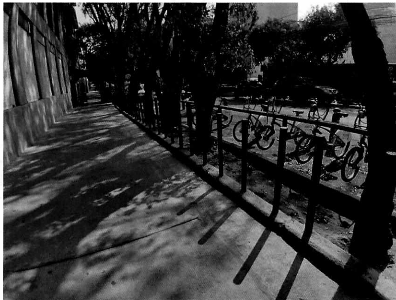
Fotografía 1. Vista de la jardinera motivo de denuncia.

En este sentido, personal de esta Subprocuraduría realizó visita reconocimientos de hechos de acuerdo a lo establecido en el artículo 15 BIS 4 fracción IV de la Ley Orgánica de esta Entidad, diligencia durante la cual se constató que el área verde en comento tiene una extensión de 18 m por 44 cm, siendo que la cerca que la delimita se recorrió aproximadamente 20 cm a lo largo de 9 m, adicionalmente, se observó que el área verde no cuenta con vegetación arbustiva o herbácea, siendo ocupada únicamente por el arbolado señalado en el apartado que antecede. En ese sentido, se hizo entrega del citatorio correspondiente a la administración del edificio en donde se desarrollaban los trabajos para la apertura de un nuevo local comercial; mismo que no fue atendido.