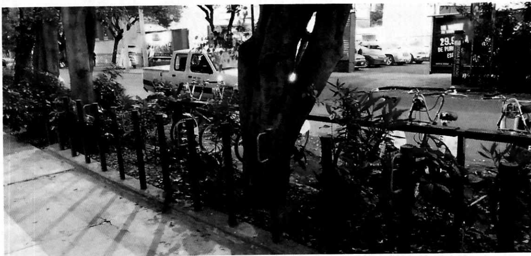
Fotografía 2. Vista de la jardinera revegetada.

Entidad, durante la cual, se observó que en la totalidad de la jardinera fueron colocadas especies ornamentales y herbáceas que reciben el mantenimiento correspondiente, al observarse en su totalidad vivas y con vigor, aunado a que se realizó el mejoramiento del sustrato sobre el cual fueron colocadas. Cabe señalar que durante la citada diligencia, se constató que los enseres del local comercial no se encuentran ocupando la superficie ajardinada.