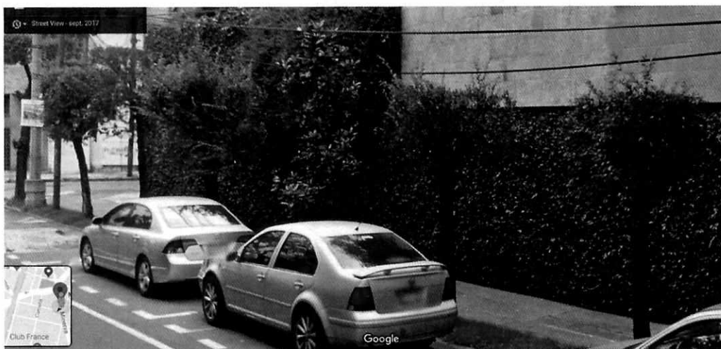
Imagen 1. Vista obtenida de "Google Maps", fechada en septiembre de 2017 y en donde se aprecia la estructura alterada del arbolado.

Adicionalmente, personal adscrito a esta Subprocuraduría llevó a cabo el análisis con la herramienta "Google Maps", a través de la cual se constató que la estructura de los árboles se encontraba modificada, con la poda observada durante visita de reconocimiento de hechos, desde el año 2017.