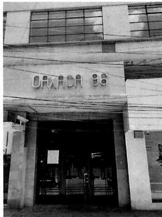
Fotografía 1. Vista de la fachada del inmueble en donde tienen lugar los hechos denunciados.

Al respecto, de las documentales que obran en el expediente, se desprende que, durante las dos visitas de reconocimiento de hechos efectuadas por el personal de esta Entidad, no fueron constatadas vibraciones desde el punto de denuncia, lo anterior, como resultado de la intermitencia del funcionamiento de la maquinaria denunciada.